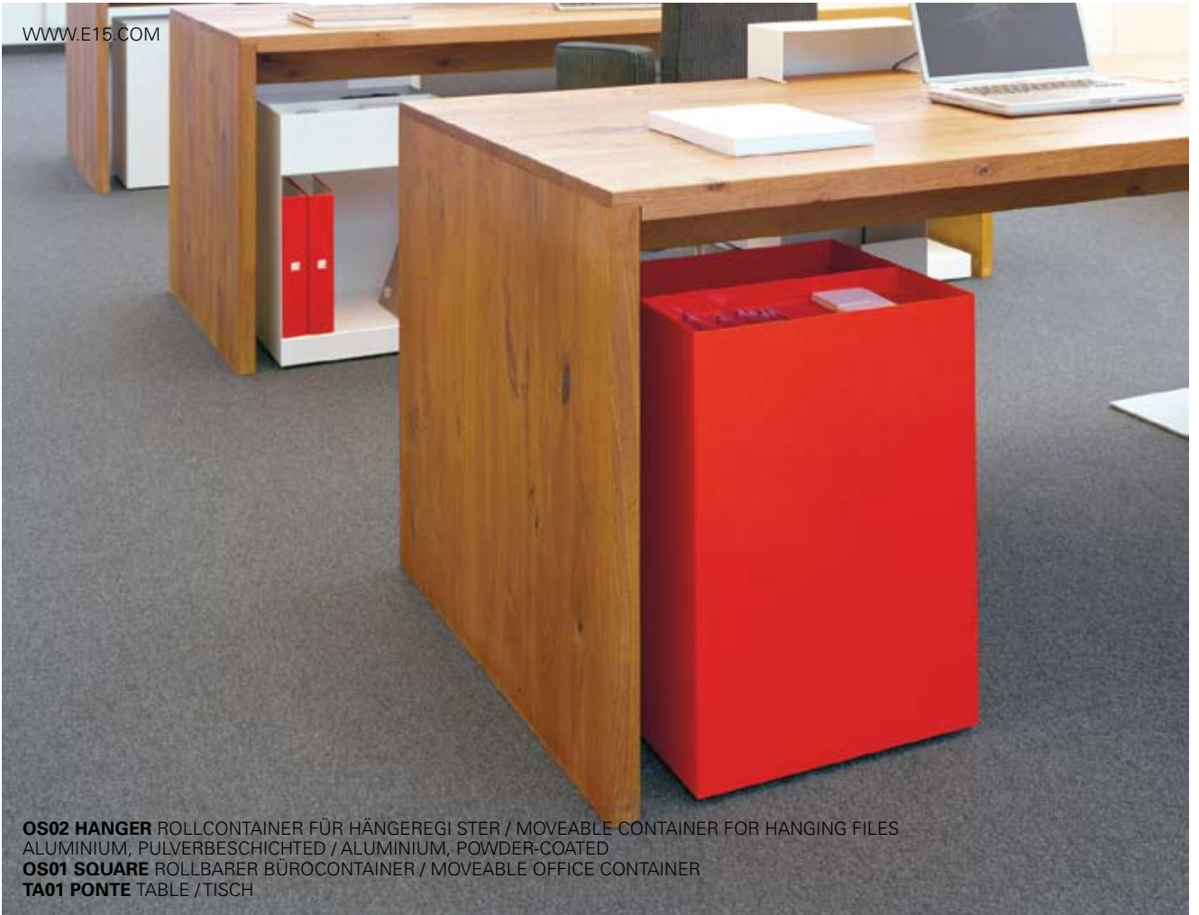
OS02 HANGER ROLLCONTAINER FÜR HÄNGEREGETER / MOVEABLE CONTAINER FOR HANGING FILES ALUMINIUM, PULVERBESCHICHTET / ALUMINIUM, POWDER-COATED OS01 SQUARE ROLLBARER BÜROCONTAINER / MOVEABLE OFFICE CONTAINER TA01 PONTE TABELL / TISCH