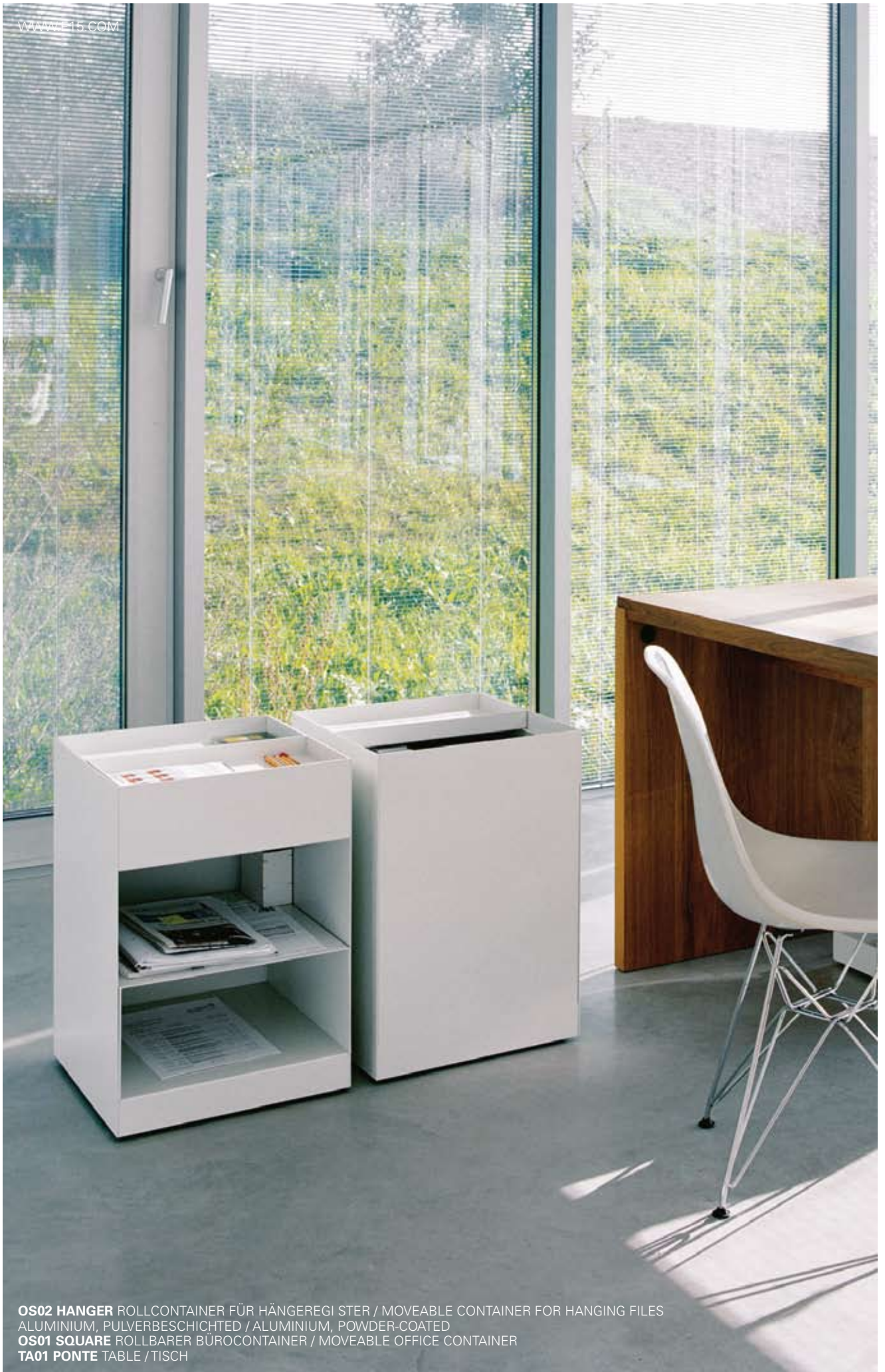
OS02 HANGER ROLLCONTAINER FÜR HÄNGEREGETER / MOVEABLE CONTAINER FOR HANGING FILES ALUMINIUM, PULVERBESCHICHTET / ALUMINIUM, POWDER-COATED OS01 SQUARE ROLLBARER BÜROCONTAINER / MOVEABLE OFFICE CONTAINER TA01 PONTE TABELLE / TISCH