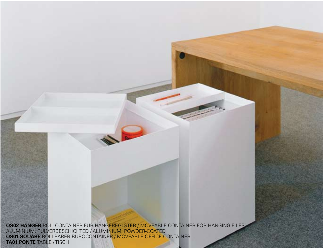
OS02 HANGER ROLLCONTAINER FÜR HÄNGEREGETER / MOVEABLE CONTAINER FOR HANGING FILES ALUMINIUM, PULVERBESCHICHTET / ALUMINIUM, POWDER-COATED OS01 SQUARE ROLLBARER BÜROCONTAINER / MOVEABLE OFFICE CONTAINER TA01 PONTE TABELL / TISCH