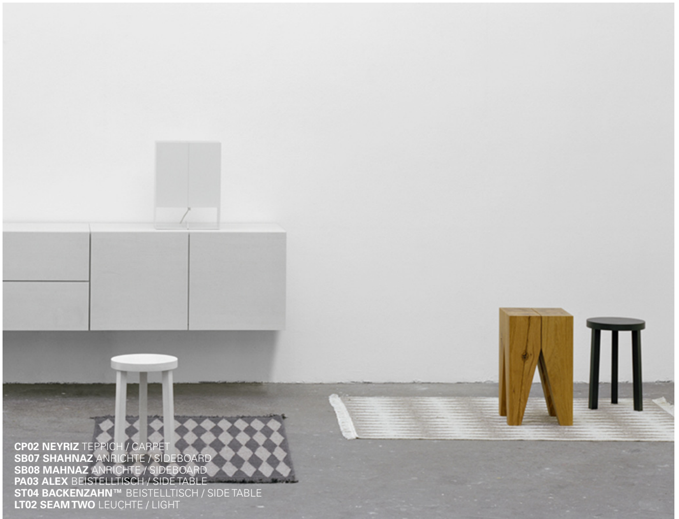
CP02 NEYRIZ TEPPICH / CARPET SB07 SHAHNAZ ANRICHTE / SIDEBOARD SB08 MAHNAZ ANRICHTE / SIDEBOARD PA03 ALEX BEISTELLTISCH / SIDE TABLE ST04 BACKENZAHN™ BEISTELLTISCH / SIDE TABLE LT02 SEAM TWO LEUCHE / LIGHT