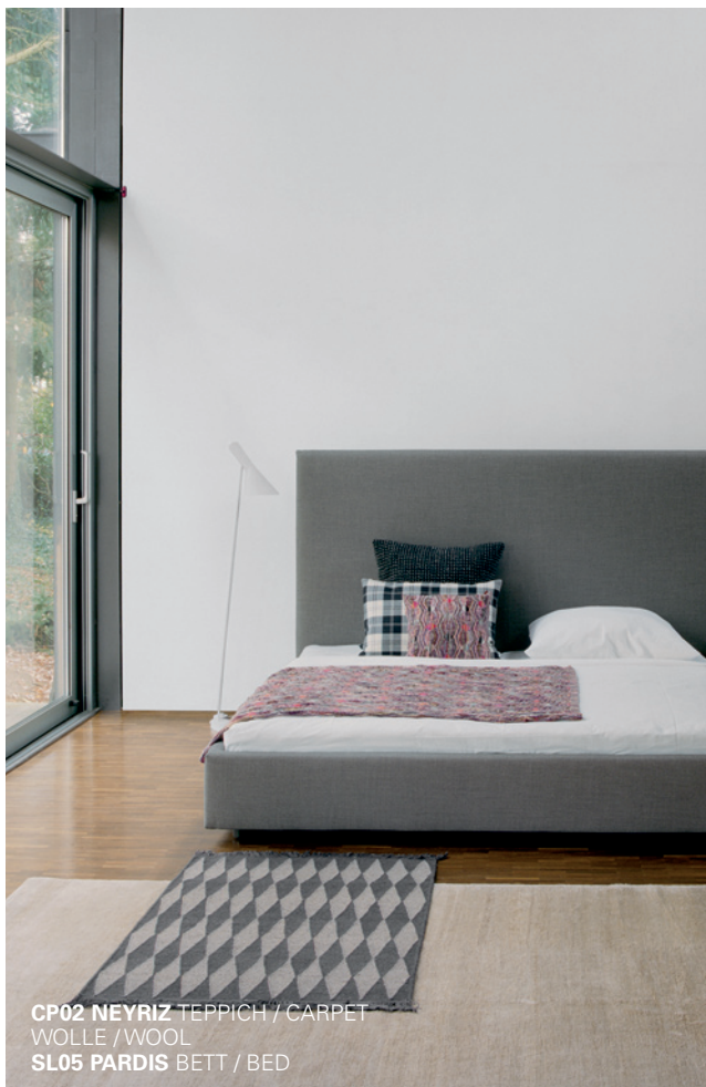
CP02 NEYRIZ TEPPICH / CARPET WOLLE / WOOL SL05 PARDIS BETT / BED