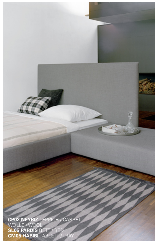
CP02 NEYRIZ TEPPICH / CARPET WOLLE / WOOL SL05 PARDIS BETT / BED CM05 HABIBI TABLETT / TRAY